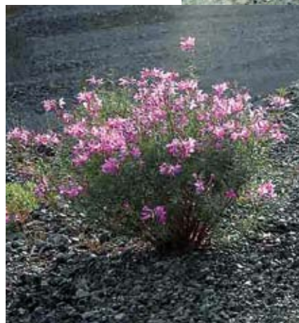
Veduta di una cava appenninica di pietre verdi e particolare della flora che vi cresce